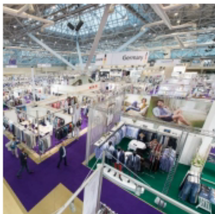
Deutschland auf der CPM vor einem Jahr

Auf der kommenden Collection Première Moskau (CPM) werden vom 31. August bis 3. September auf dem Messegelände Expocentre in Moskau insgesamt 352 deutsche Labels ausstellen. Es ist damit die größte Länderbeteiligung auf der Messe. Im Forum, wo traditionell die deutschen Anbieter angesiedelt sind, zeigen u.a. Olymp, Daniel Hechter, Lagerfeld, Bugatti, Riani, Rich & Royal, Brax, Couture One und Broadway. Marc Cain wird sich erneut mit Modenschauen präsentieren.